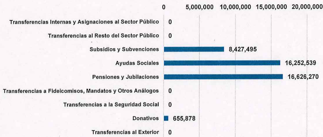
Transferencias, Asignaciones, Subsidios y Otras Ayudas del Ayuntamiento de La Piedad, Michoacán del 1 de enero al 31 de diciembre de 2023 (pesos)

Del análisis de la distribución del presupuesto devengado en este capítulo, se conoció que los conceptos que ejercieron el mayor gasto fueron Pensiones y Jubilaciones con el 40 por ciento, y Ayudas Sociales con el 39 por ciento del total.