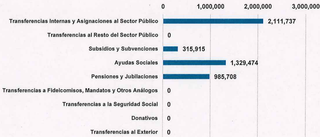
Transferencias, Asignaciones, Subsidios y Otras Ayudas del Ayuntamiento de Queréndaro, Michoacán del 1 de enero al 31 de diciembre de 2023 (pesos)

Del análisis de la distribución del presupuesto devengado en este capítulo, se conoció que el concepto que ejerció mayor gasto fue Transferencias Internas y Asignaciones al Sector Público con el 45 por ciento del total.